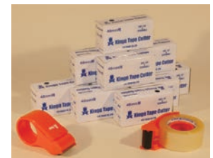
キングアルファ OPPテープカッター 48mm 用