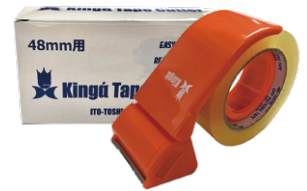
キングアルファ OPPテープカッター 48mm 用 TK-48